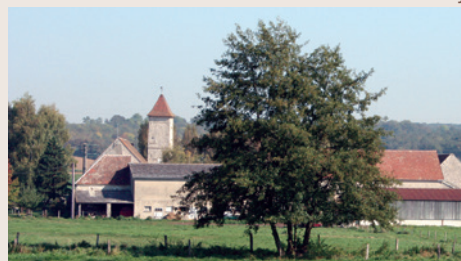
Ferme de Launay

Comité du Val-d'Oise, 01 30 35 81 82, www.cdvp95.com